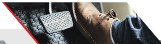
Ausgezeichneter Komfort und Gefühl