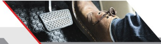
Ausgezeichneter Komfort und Gefühl