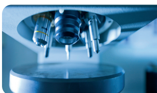
Spezielles Produktdesign entspricht den OE Ansprüchen