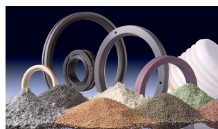
Hochwertige Rohstoffe für erstklassige Ersatzteile