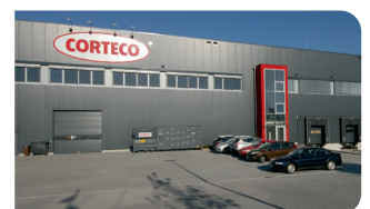
Globale Lieferkette, dem Ersatzteilmarkt zugeordnet