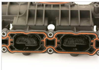
Abbildung 2: Saugrohr mit Tumbleklappen