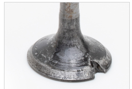
Abbildung 3: Ventil mit deutlich sichtbaren Abschmelzungen