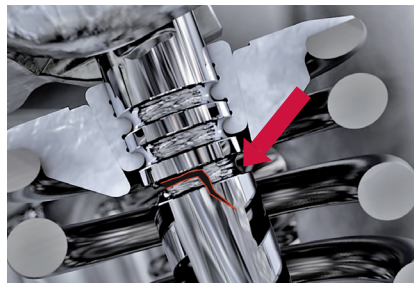
Abbildung 2: Ventilbruch an der untersten Rille und quer zum Schaft