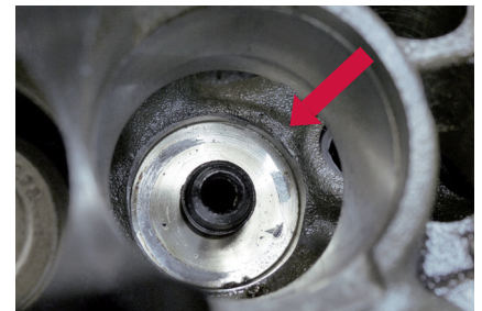
Abbildung 3: Druckspuren am Zylinderkopf